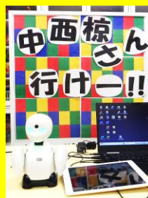
オリヒメ 分身ロボットOriHime