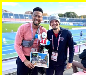
パラバスケットボール アメリカ代表選手と 分身ロボットOriHimeで交流