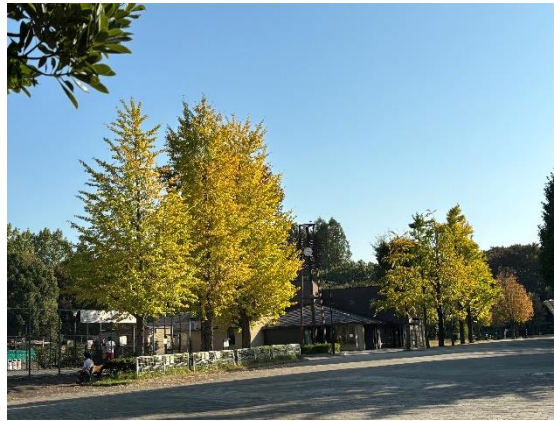
あかつかこうえんない 赤塚公園内