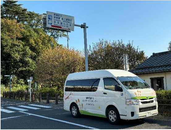
あかつかためいけこうえん 赤塚溜池公園