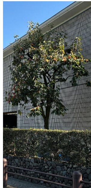
かき き 柿の木