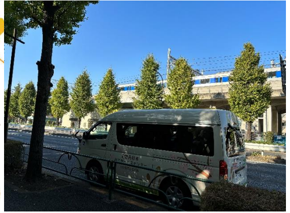
たかしまだいらかいどう 高島平街道