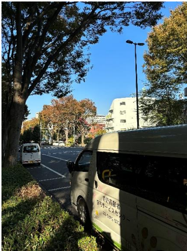
あかつかこうえん 赤塚公園