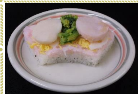
ひなちらし 三色の押し寿司の上に 紅白の帆立をのせています