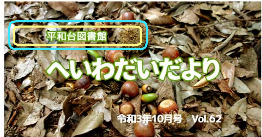
撮影地 どんぐり山憩いの森公園(北町7丁目12-15) 撮影 令和3年9月22日