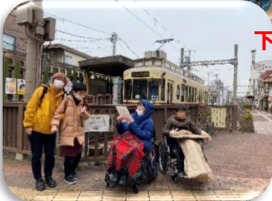
昭和にタイムスリップ！

そらグループのお楽しみ外出は、都電荒川線の車両を貸し切った乗車体験（2回目）です！今回もレトロな雰囲気の車両である9000系を希望しました。社内のアナウンスもしっかりと聞きながら荒川車庫前駅～三ノ輪橋駅区間の約20分間、車窓を見ながら楽しみました☆