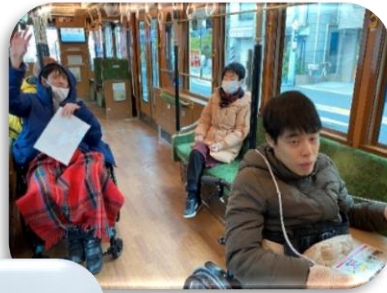
下町をのんびり運行中♪