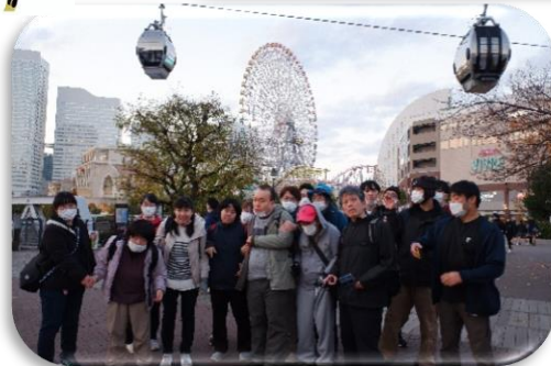
エアキャビン前で記念撮影！