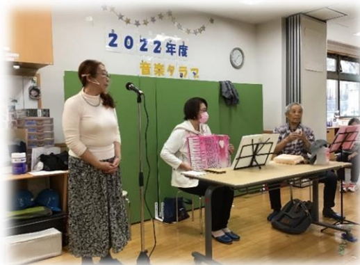
↑ 素晴らしい歌声を披露していただきました(*^^*)