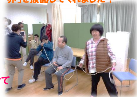
↓ うみ音楽クラブは皆で楽器が付いた紐を持ち「小さな世界」を披露してくれました！