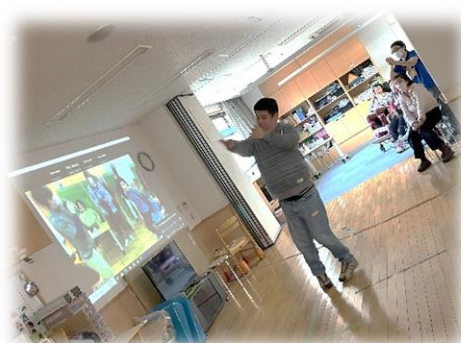
↑ ZOOM から聞こえる曲に合わせてダンス♪