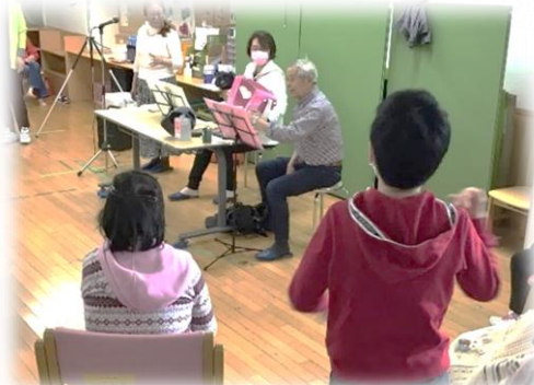
↑ 気分も盛り上がりますね★