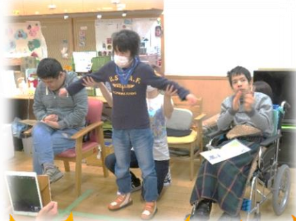
↓ ゆったりクラブは、ヨガの実演！ 英雄のポーズです★

当日は発表があるということで緊張した表情の方もいましたが、映像の中ではリラックスして楽しまれている方が多く、それぞれ充実したクラブ活動だったことが伺えました★