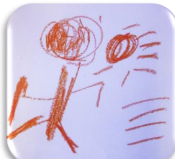
掲載されたイラストです★