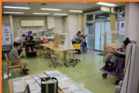
ソーシャルディスタンスを意識しながら活動をしています。