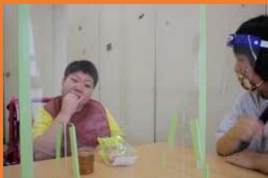
飛沫感染予防のためのパーテーションを設置し、食事を召し上がっていただいています。