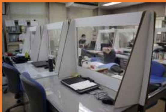
事務所内でも対面する机の間にパーテーションを設置しています。