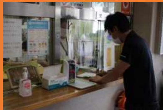
事務所カウンターに飛沫感染防止のため、透明シートをシールドとして取り付けています。