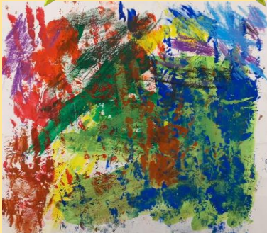
こすもす班 題:グリーンガーデン