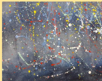
ひまわり班 題:冬の星空