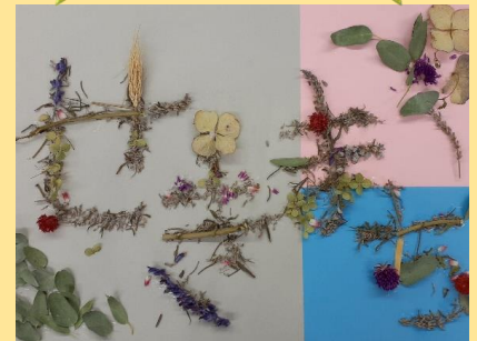
すみれ班 題:せきまちガーデン

12月12日(火)~15日(金)の期間、練馬区役所本庁舎1階アトリウムにて「ふれあい作品展」が開催されました。