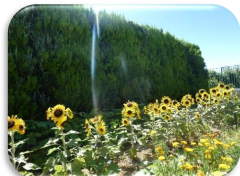
おひさまをいっぱいあびて、ひまわりがたくさん咲きました🌻